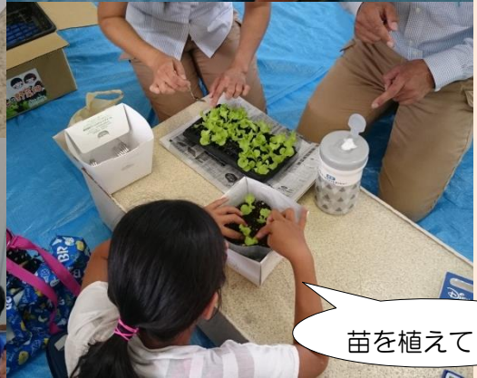
苗を植えて・・・