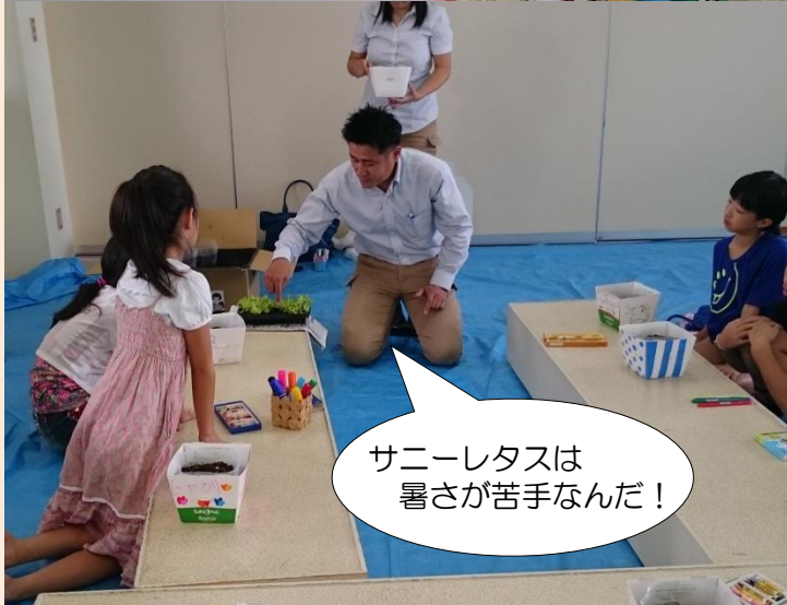
サニーレタスは暑さが苦手なんだ！